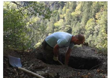
• Najskôr bolo potrebné vykopať základ

Vyhladka mala stáť už začiatkom decembra, akcia však stroskotala na slabšom záujme. Potrebujeme už len 2 – 3 dni na osadenie priamo na Kobylinách. Pevne verím, že bude vhodné počasie a podarí sa práve vtedy dať dohromady i partiu, aby sme projekt zdarne ukončili.