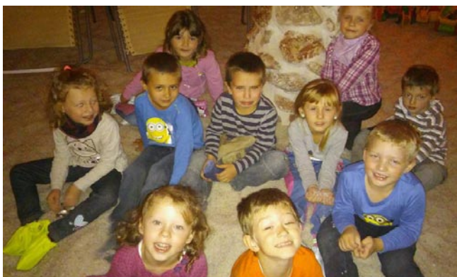
• V soľnej jaskyni v Liptovskom Mikuláši