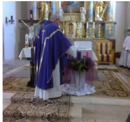
• Zapálenie prvej adventnej sviečky

Ďalšou nedeľou 29. 11. začalo obdobie adventu. Na adventnom venci sa rozsvietila 1. svieca, ktorá by sa mala rozsvietiť vo všetkých rodinách a priniesť do rodín opravdivé svetlo. Slovo advent znamená príchod, preto pripravme sa na tento príchod, ktorým je sám Pán Ježiš a