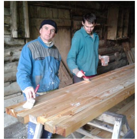
• Natieranie drevených dielov vyhladky