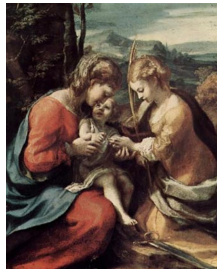
• A. Correggio, Mystické zasnúbenie s Kristom , 1518