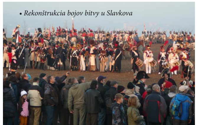
• Rekonštrukcia bojov bitvy u Slavkova