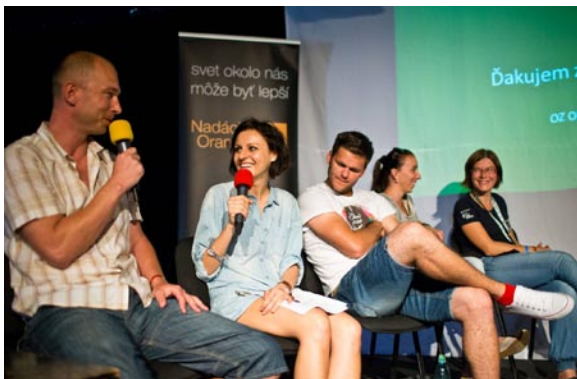
• Prezentácia na Festivale Pohoda

Na festivale som v spoločnosti podstatne väčších neziskových organizácií, zväčša z okresných a krajských miest, odľahčenou formou odprezentoval naše aktivity a spropagoval i našu lokalitu ako takú. Ovácie zožali i chlapi z DHZ Kvačany, prítomní na fotkách a v príhodách v mojej prezentácii.