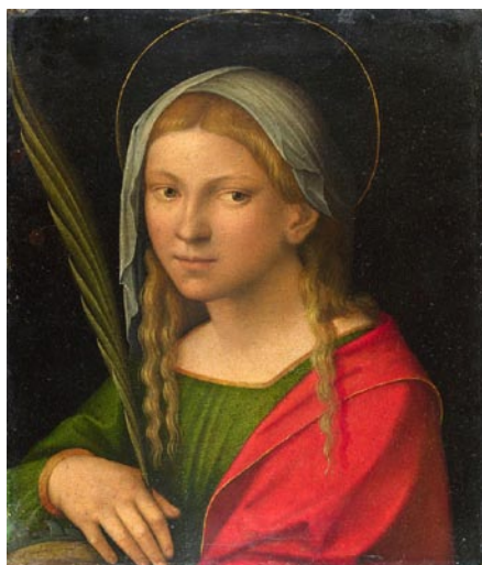
• B. Tisi da Garofolo, Sv. Katarína

kom. Práve na tomto mieste sa Mojžiš, vodca Izraelitov, stretáva s Bohom v horiacom kre. Sv. Helena, matka cisára Konštantína tu dala postaviť Kaplnku Horiaceho kra.