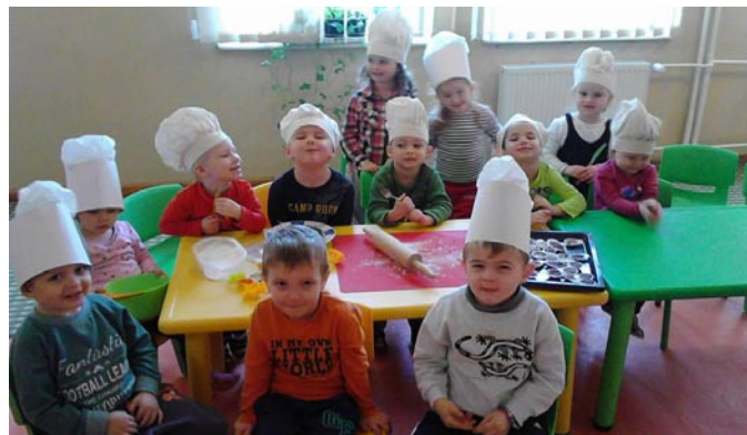
• „Šťastné a veselé“