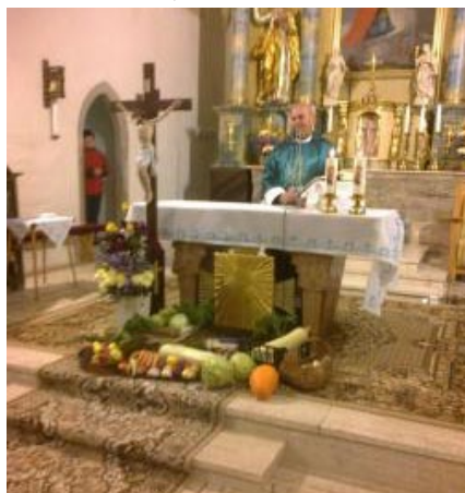
• Posvätenie úrody

1. 10., keďže bol prvý štvrtok v mesiaci, po sv. omši bola adorácia, ktorá bola venovaná za kňazov. 9. 10. bolo svätenie úrody.