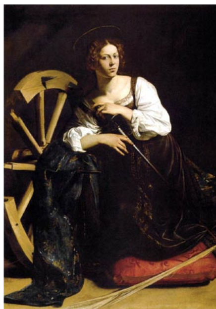
• Caravaggio, Sv. Katarína, 1595