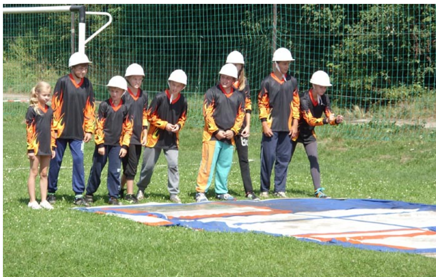
• Mladí požiarnici si zasúťažili