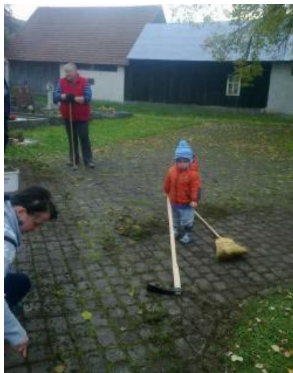
• Brigáda na cintoríne