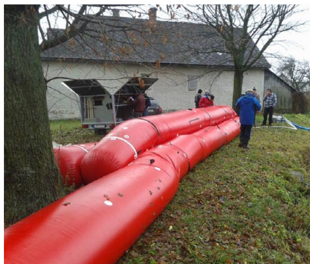
• Praktická ukážka protipovodňovej ochrany