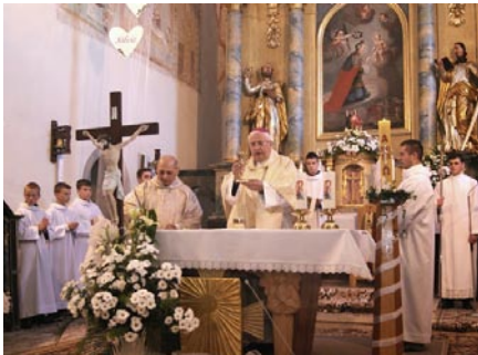
• Služenie sv omše s duchovným otcom biskupom

a poďakoval za prácu, ktorú sme vykonali na rekonštrukcii nášho kostolíka, či to už v interiéri alebo exteriéri kostola, taktiež na farskom úrade, za poriadok v ich okolí, ale aj celkove za čistotu a poriadok celej dediny. Vycítil, že máme nášho vdp. farára radi. A že za jeho 13 ročného pôsobenia sme urobili veľké Božie dielo. My sme mu tiež povedali že sme radi a že ďakujeme Pánu