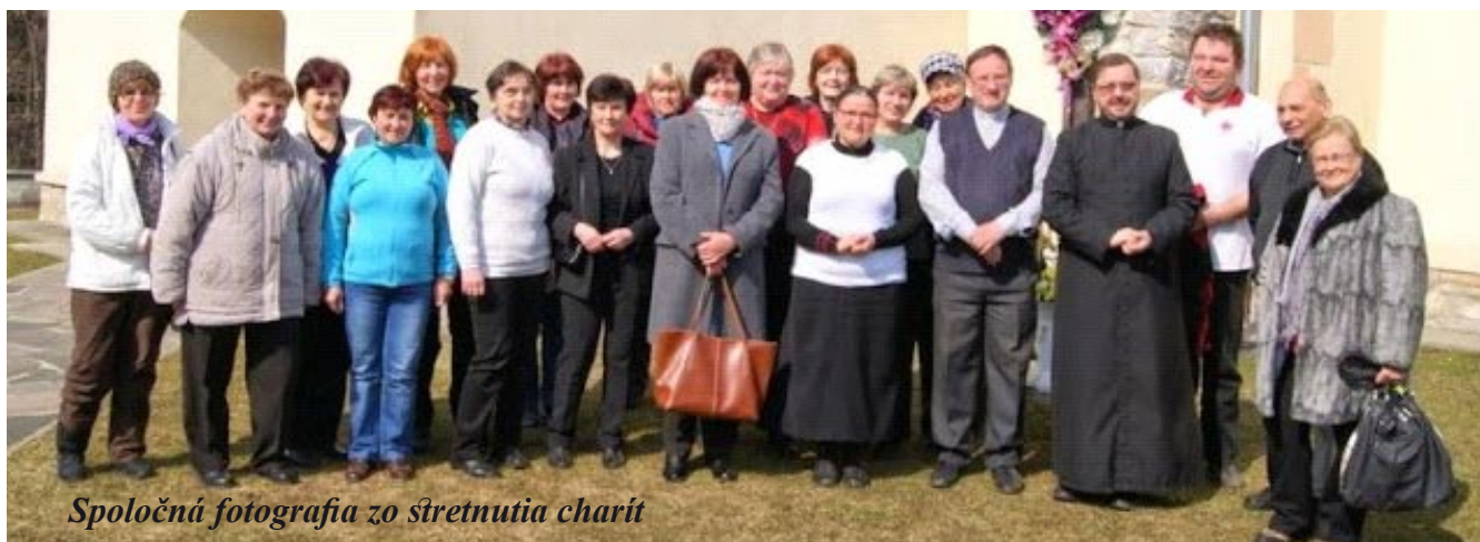
Spoločná fotografia zo stretnutia charít

Všemohúci a večný Bože, Pán pokoja a lásky, prijmi naše vďaky a prosby a neustále nás chráň pred každým nebezpečenstvom. Skrze Krista, nášho Pána.