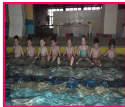
• Predplavecký výcvik v Liptovskom Mikuláši

A nakoniec? Nakoniec sme sa rozlúčili so 14 predškolákmi, ktorí sa už tešili do školy.