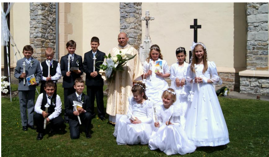
• Z prvého svätého prijímania

„Božské srdce buď s nami, kraluj panuj nad nami, nech sa v našej rodine, život viery rozvinie.“