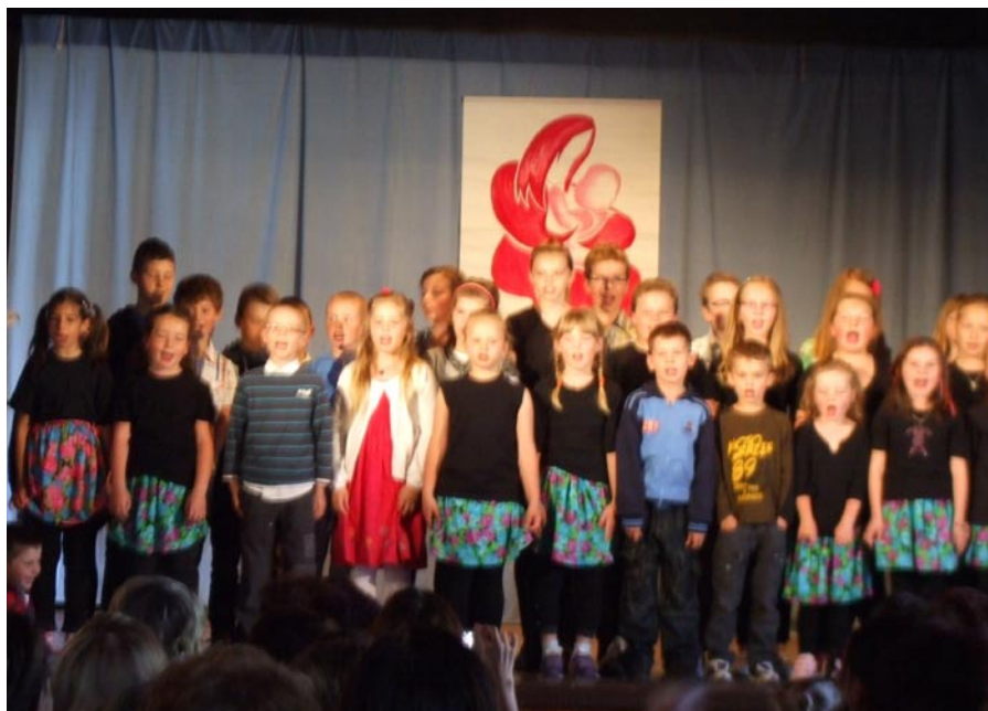
• Z oslavy Dňa matiek