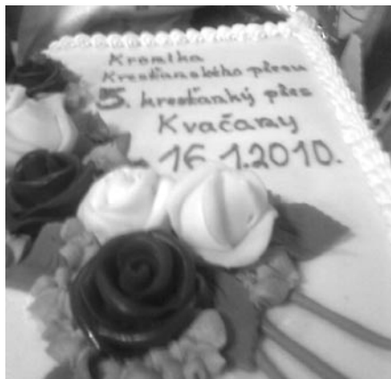
• 1. cenu do tomboly, tortu, venovala firma Pralinka

V polovici januára, ako to už tradične cez fašiangy býva, sme poriadali „Katólicky ples“. Bol to už 5. jubilejný ples, na ktorom sa vždy, ako jedna rodina, zabavíme. Tento rok bol výnimočne veľmi veselý. Bol vyplnený vtipným, pekným programom, ktorý nám pripravili budúci birmovanci. Všetci sme sa na ňom zasmiali a pobavili. Niektorí z účinkujúcich, ba väčšina nás prekvapili svojim hereckým talentom. Všetkým touto cestou vyslovujem úprimné Pán Boh zaplať a tešíme sa s nimi, ako im vdp. farár povedal, pripraviť „Silvester 2010“.