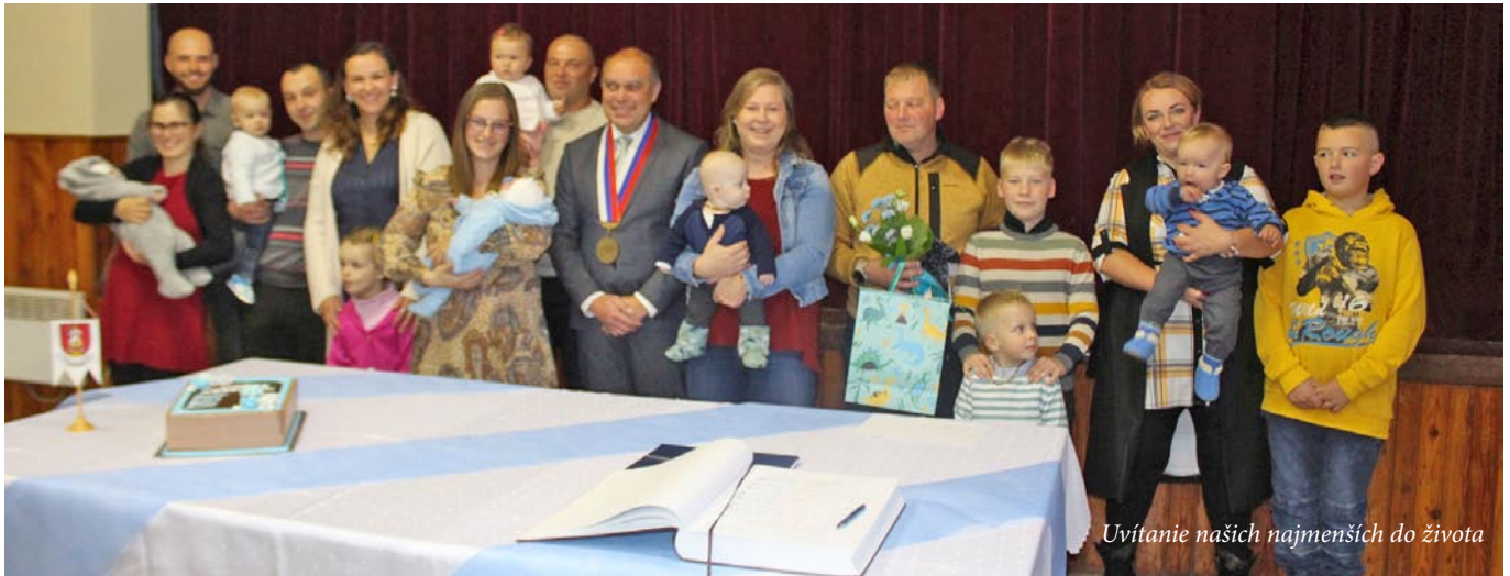
Uvítanie našich najmenších do života