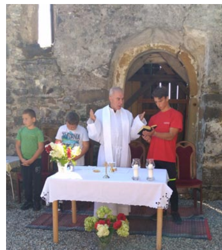
Sv. omša v zrúcanine kostola sv. Anny v Lipt. Anne

V septembri po dlhšom čase 11.9. vdp. farár naplánoval púť do Lipt. Anny na zrúcaninu bývalého kostola, zasvätený Sv. Anne. O 8. hod, sa išlo od kostola peši do Prosieka a poľom do Lipt. Anny, kde o 10.30 hod bola sv. omša, ktorú slúžil náš vdp. farár. Čakali nás tam už tri tunajšie ženy, ktoré