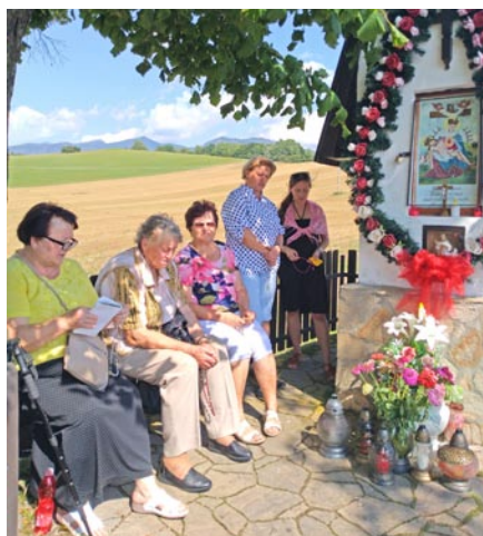
Pobožnosť pri kaplnke Sedemb. Panny Márie