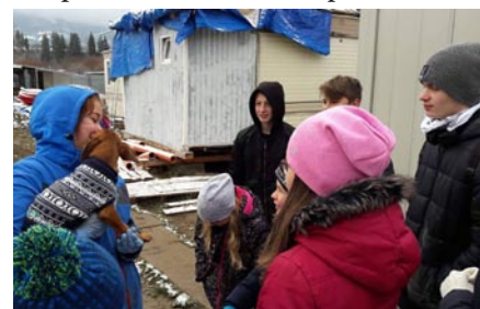
• Psí útulok