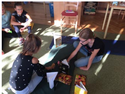
• Trenujeme komunikačné situácie

Exkurzie, kultúrne podujatia, dobrovoľnícke aktivity, tvorivé dielne a mnoho iných netradičných foriem vzdelávania sa už uskutočnilo od septembra v našej škole. Celým týmto obdobím sa prelínajú aj aktivity vyplývajúce z projektu s názvom Povedz mi to ako partner, ktorý nám podporila Nadácia pre deti Slovenska sumou 5 300 €. Projekt s celkovým rozpočtom 7 445 € rieši rozvoj rešpektujúcej komunikácie medzi učiteľmi, žiakmi a rodičmi. Po minuloročnom absolvovaní kurzu Rešpektovať a byť rešpektovaný učiteľmi tak pokračujeme v tejto našej snahe o budovanie dobrých vzťahov. V dňoch 27. - 28. októbra 2018 absolvovalo kurz rešpektujúcej komunikácie 24 rodičov, ktorý odborne zabezpečilo občianske združenie R+R v spolupráci s Asociáciou Susan Kovalik. Venovali sa cieľom výchovy, komunikácii a potrebám detí i mladých ľudí. Učili sa ako stanoviť dieťaťu hranice správania sa, ako vyjadrovať oprávnenú požiadavku či opisným spôsobom dať spätnú väzbu. Dozvedeli sa o tom, ako funguje mozog a prečo je rešpektujúci model vzťahov vo výchove a vzdelávaní efektívnejší ako mocenský. Trénovali formy