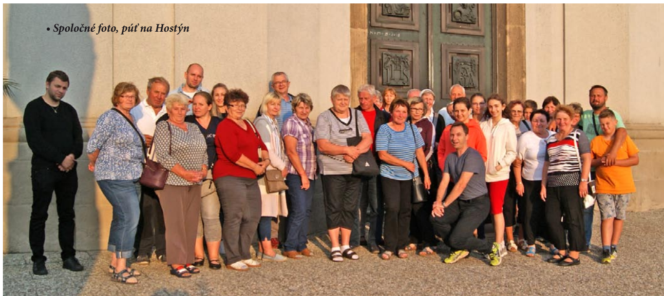
• Spoločné foto, púť na Hostýn

25. 8. sa konala medzinárodná mariánska púť venovaná matkám. Bolo to spojenie púti z Poľska, z Čenstochovej, cez Slovensko a Maďarsko až do Chorvátska, do Medžugoria. Celá púť bola rozdelená na úseky dlhé cca 25 km. Pre našu farnosť bol určený úsek z Kvačian, od kostola, až do kostola vo Vyšných Liptovských Sliačoch. Mohli sa pripojiť aj farníci z okolitých farností, ktorí boli dopredu informovaní. Celkovo sa na tejto púti zúčastnilo 31 ľudí vrátane detí. Na začiatok púte sme sa pomodlili jeden desiatok radostného ruženca. Potom vdp. farár posvätil nový drevený pútnický kríž a všetkým udelil pútnické požehnanie. Trasa našej púte bola nasledovná: Išlo sa do kaplnky, kde sa pridali veriaci z Dlhej Lúky. Tam sme sa pomodlili ďalší desiatok ruženca. Ďalej sa išlo popod horu do Prosieka, cez Bukovinu, Kalameny, Ivachnovú až do Liptovských Sliačov. Na určitých miestach sa pokračovalo v modlení ru-