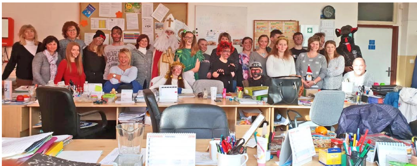
• Mikuláš v Základnej škole