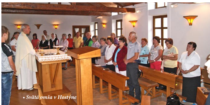
• Svätá omša v Hostýne