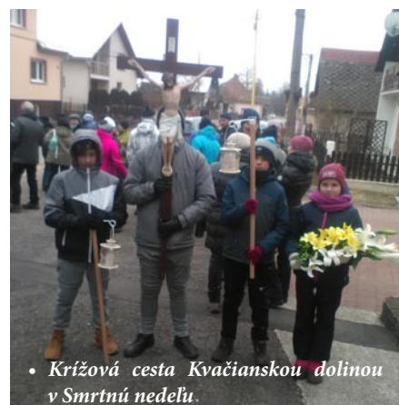
• Krížová cesta Kvačianskou dolinou v Smrtnú nedeľu.

žena a posledný desiatok sa domodlil pri kostole v Lipt. Sliachoch. Najväčšia pochvala patrí starším a deťom, ktoré absolvovali túto 25- kilometrovú púť až do konca. V Liptovských Sliachoch čakal našich veriacich autobus a o 16:30 ich odviezol do Kvačian, do kostola, kde bola sv. omša s platnosťou na nedeľu. Ženy, ktoré nešli na púť pripravili agapé, kde sa všetci prítomní mohli pohostiť chutnými domácimi koláčmi a dobrým vínom.