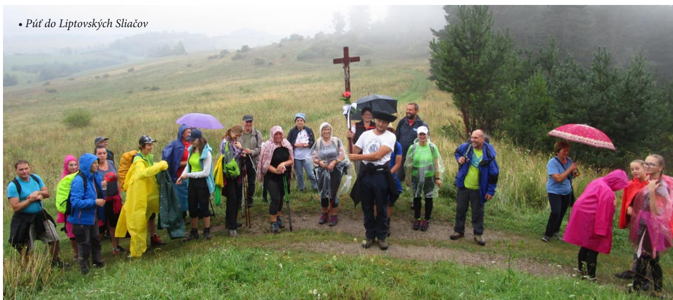
• Púť do Liptovských Sliachov

01. 11. na sviatok Všetkých Svätých sme v popoludňajších hodinách navštívili oba cintoríny. Ako každý rok sme tu mali pobožnosť. Na začiatku pobož-