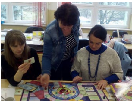
• Učiteľia sa oboznamujú s hrou Cashflow finančne gramotní

Národného štandardu finančnej gramotnosti a výchovy k podnikaniu.