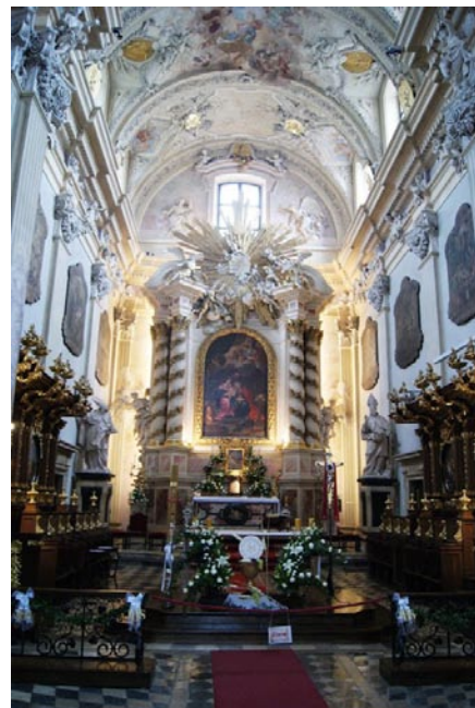
Oltár v kostole v Krakove

19. –20. 5. - mnohí z našej farnosti sa zúčastnili poznávacieho zájazdu do Krakova. Zorganizoval ho náš vdp. farár, za čo mu patrí veľké poďakovanie. Pred odchodom ráno o 7. hod. sme mali v Kvačanoch spoločne sv. omšu. O 11. hod. sme už boli v Krakove, kde sme mali prehliadku mnohých chrámov.