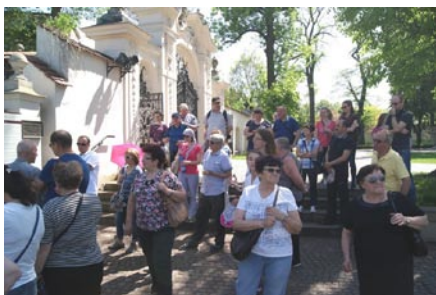
Prehliadka mesta Krakov

Ubytovatí sme boli v Lagievnikach, kde sme si večer prezreli Svätýňu Božieho milosrdenstva a Centrum Jána Pavla II. Na druhý deň sme mali sv. omšu v Slovenskej kaplnke v Lagievnikach a prezreli sme si ďalšie chrámy v Krakove. Prežili sme veľmi pekný duchovný zážitok. Všade nás sprevádzal a robil výklad náš duchovný otec. Okrem našich veriacich, boli aj veriaci a známi nášho vdp. farára, čiže nás bolo plný autobus.