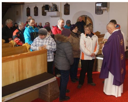
Návšteva kostola na Hutách 11. 3. 2017