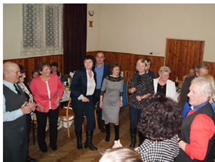
Fašiangové stretnutie 11. 2. 2017