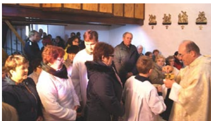
Posvätenie obnovej kaplnky Božského srdca Ježišovho 4. 11. 2017

3. 12. - vstúpili sme 1. Adventnou nedeľou do obdobia Adventu. Počas adventu ,by sa mal každý trochu stíšiť, porozmýšľať nad sebou, nad svojim životom a tak v najlepšom duchu sa