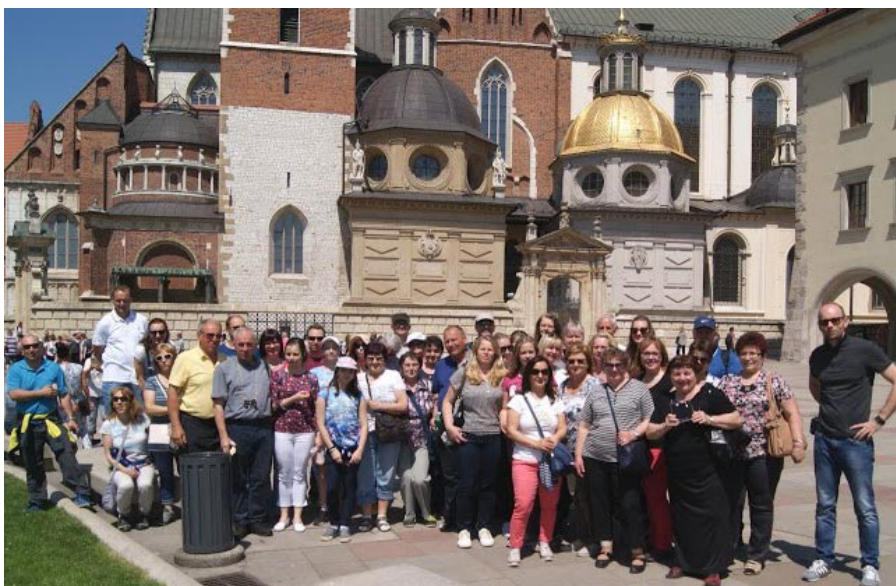
Spoločné foto z Krakova

Ubytovatí sme boli v Lagievnikach, kde sme si večer prezreli Svätýňu Božieho milosrdenstva a Centrum Jána Pavla II. Na druhý deň sme mali sv. omšu v Slovenskej kaplnke v Lagievnikach a prezreli sme si ďalšie chrámy v Krakove. Prežili sme veľmi pekný duchovný zážitok. Všade nás sprevádzal a robil výklad náš duchovný otec. Okrem našich veriacich, boli aj veriaci a známi nášho vdp. farára, čiže nás bolo plný autobus.