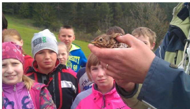
V prírode s ornitológom