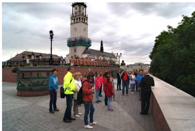
Púť do Poľska - Čenštochova