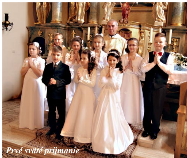
Prvé sväté prijímanie

Posledná naša púť doteraz bola na sviatok Cyrila a Metoda, na Veľké Borové. S touto púťou, sme boli po vyhlásení vdp. farárom, veľmi prekvapení. Vdp. farár po organizačnej stránke všetko