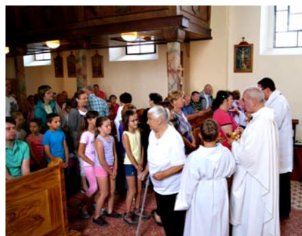
Púť na Veľké Borové

a krvi Kristovej boli oltáriky okolo kostola. Dievčatá rozsypali kvietky. Bolo dobré počasie.