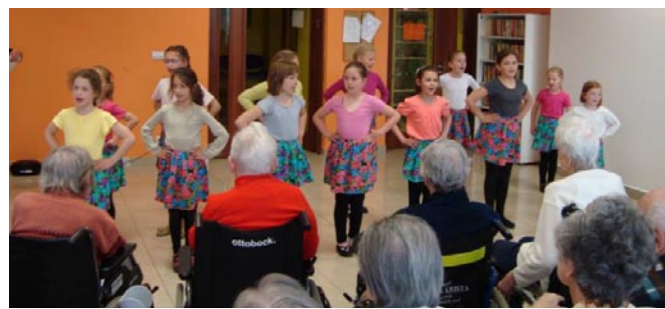
Vystúpenie žiakov v domove dôchodcov