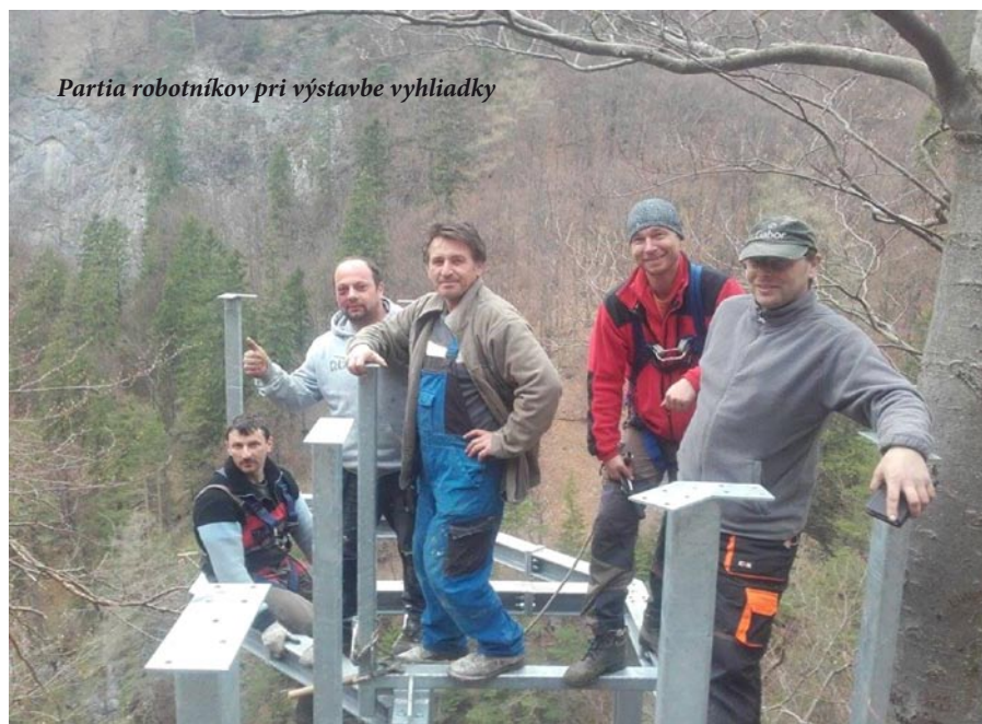
Partia robotníkov pri výstavbe vyhlídky

Z doterajšieho pozorovania môžem povedať, že sa razom zaradila medzi najväčšie atrakcie doliny a Kobyliny už dnes obídu iba tí najviac opatrní, pri-