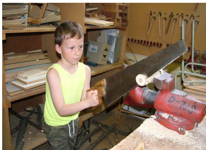
Projekt Skúsme to spolu

Na začiatku budúceho školského roka, ktorý bol vyhlásený za Rok čitateľskej gramotnosti, sa sústreďíme na dokončenie odbornej učebne fyziky a chémie, odbornej učebne výchovných predmetov 1. stupňa a viac pozornosti a investícií si zaslúži žiacka školská knižnica. V školskom areáli je potrebné inovovať náučné tabule a zo zisku z letnej činnosti školy plánujeme prispieť na výstavbu workoutového ihriska v priestore za telocvičňou školského areálu.