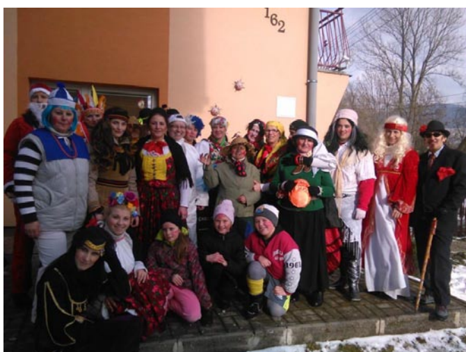
Fašiangový pochod obcou Kvačany