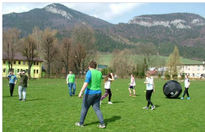
Svetový deň zdravia – Hodinka športu