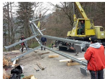
Stavba vyhlídky v Kvačianskej doline