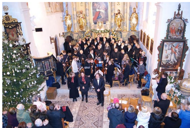
Vianočný koncert v kostole