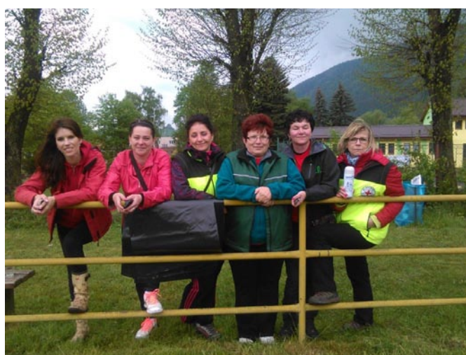
II. ročník futbalového turnaja KAMA CUP