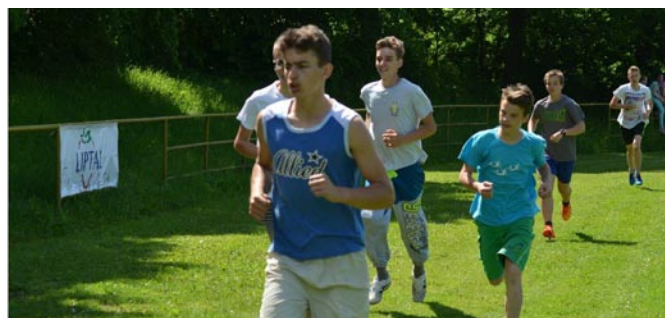
Atletický päťboj O pohár riaditeľky školy

Kým v roku 2000 školu navštevovalo už len 240 žiakov, v roku 2015 bolo v škole zapísaných 166 žiakov. Do budúceho prvého ročníka sme zapísali 14 žiakov, v júni zo školy odiš-