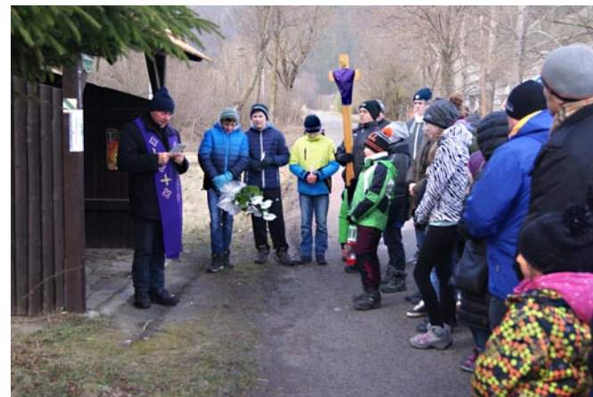
Krížová cesta do Kvačianskej doliny