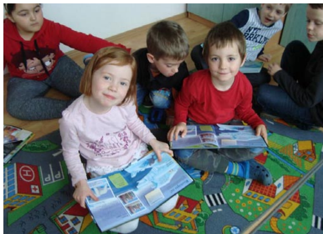
Prváci – Týždeň zaujímavého čítania

No najprv je pred nami leto. Verím, že bude naplnené slnečnými dňami a samými príjemnými zážitkami. Všetci zrelaxujeme, načerpáme pozitívnu energiu i inšpiráciu a k septembru zodpovedne pripravíme podmienky pre päťdesiaty druhý rok našej úspešnej kvačianskej školy.