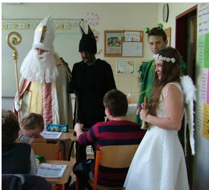
Mikuláš v škole