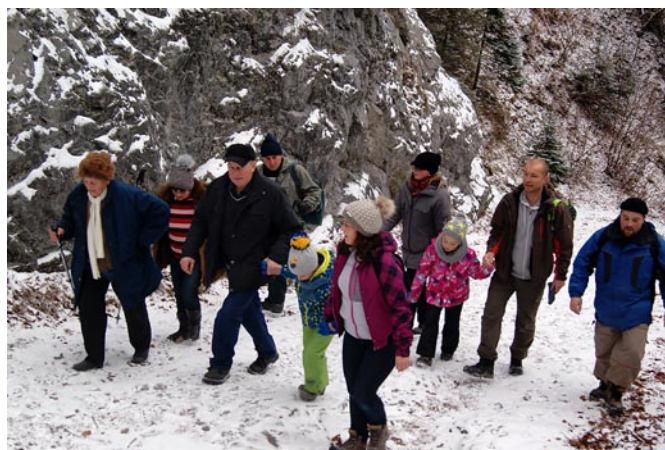
Nový rok v Oblazoch

Keďže 13.marca v našej farnosti býva vyložená Sviatosť oltárna, mal každý možnosť až do 17.00 hod. sa pokloniť k Pánovi Ježišovi. Tí, čo sa vracali z doliny, mnohí sa tiež prišli pokloniť. Bola to nedeľa, akú Kvačanci, tak duchovne