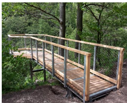
Vyhliadka na Kobylinách

čom v minulosti veľká časť ľudí Kobyliny z obáv o svoju bezpečnosť zďaleka obchádzala. Zabezpečená vyhliadka tiež už aj bez namontovaných ostatných zábradlí sťahuje na seba návštevnosť, ktorá inak smerovala prevažne mimo značeného chodníka. A už teraz verím plní svoj účel: „Chrániť ľudí, prírodu a popritom propagovať ako naše prírodné krásy, tak i samotnú dobrovoľnícku činnosť“.