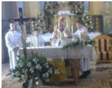
• Vianočná sv. omša

pravila pre veriacich k Vianociam malú flaštičku chutného včelieho medu, za čo jej všetci veľmi pekne ďakujeme. Bol to jej vlastný výrobok. Dobrovoľný finančný príspevok, bol odovzdaný pokladničke farskej charity. Pre vysvetlenie, takéto finančné výťažky sú použité alebo budú použité pre ťažko chorých, ktorí sa nachádzajú v núdzi alebo ako to bolo tohto roku, že tým, ktorí nevládu prísť do kostola, členky farskej charity ich 11. 2. 2015 – „Deň chorých“ navštívili a potesili malým balíčkom sladkostí.