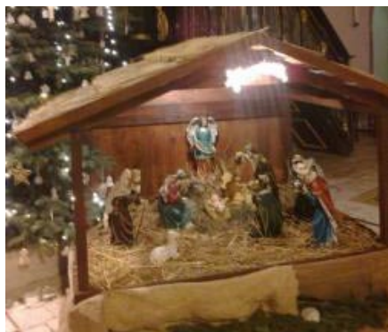
• Náš betlehem

Vianočné sviatky sme sa snažili prežiť v pokoji v rodinnom kruhu. Pre niektorých boli smutné, keď im pri sviatočnej večeri ostala jedna stolička voľná, pre iných boli radostné, keď im pribudol do rodiny ďalší člen. Polnočná sv. omša bola o 22. hod a do kostola nás sprevádzali miestnym rozhlasom vianočné koliedy. Na oblohe svietili jasno hviezdičky, len nám k vianočnej atmosfére chýbal sneh. Na Božie narodenie 25. 12. už pršalo a na sv. Štefana bola veľká fujavica, takže na pobožnosti pri jasičkách, kedy bola vyložená aj sviatosť oltárna, nás bolo veľmi málo.