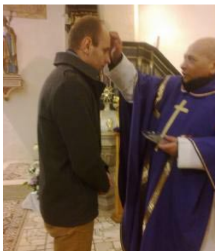
• „Kajajte sa a verte v evanjeliu“

Vyvrcholením pôstu nie je Veľký Piatok, ale Veľkonočná nedeľa, kedy na úsvite vstal zmŕtvych Pán Ježiš, ktorý nás svojou smrťou vykúpil a oslobodil od hriechov. Nech v každom chráme zaznie o 5 týždňov to radostné „ALELUJA. Pán Ježiš Kristus vstal zmŕtvych, radujme sa“. Počas pôstu by sme sa mali všetci veriaci duševne pripraviť a splniť si základnú povinnosť kresťana tým, že prijímame sviatosti zmierenia.