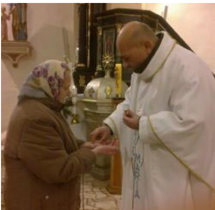
• Pomazanie chorých

11. 2. 2015 bol sviatok Panny Márie Lurdskej - svetový deň chorých. Farská charita zakúpila tým veriacim, ktorí nevládzu prísť do kostola, malé balíčky (27 kusov), členky farskej charity ich navštívili a sa s nimi porozprávali. Veľmi ich to potešilo a boli za to povďační. Prítomní, čo boli večer na sv. omši, dostali pomazanie chorých.