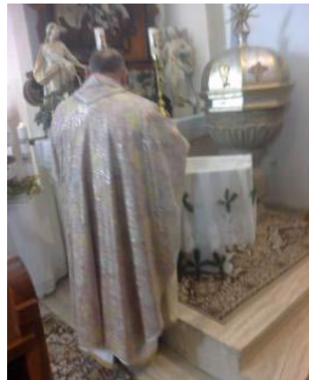
• Svätenie Trojkráľovej vody