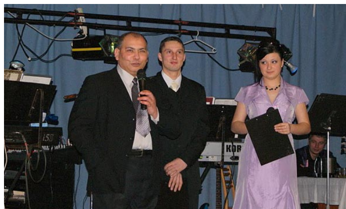
• Z otvorenia VI. Katolíckeho plesu