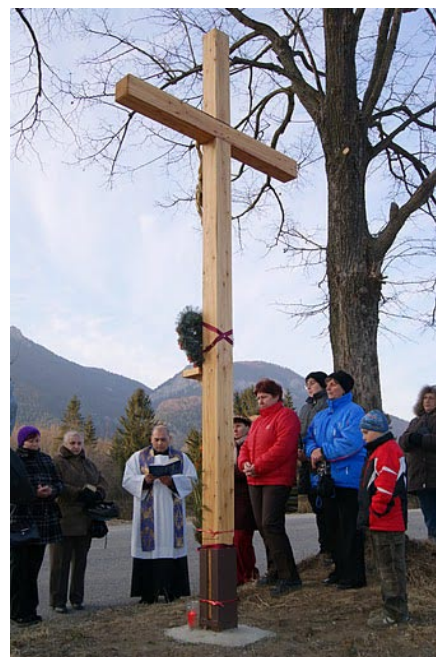
• Vysviacka kríža na Suche, 9. marca 2011